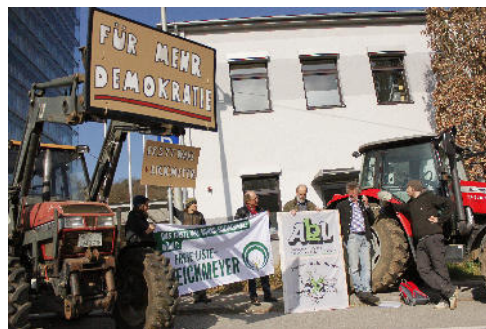
Imker, Bauern und Kleinflächenbesitzer bei einer Kundgebung für gerechte Beiträge vor der SVLFG in Stuttgart.