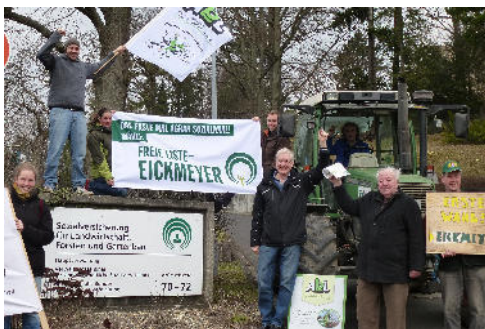
Bauern protestieren gemeinsam mit ihrem Spitzenkandidat vor der SVLFG in Kassel für eine gerechte Agrarsozialpolitik.